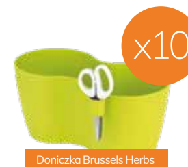
Doniczka Brussels Herbs