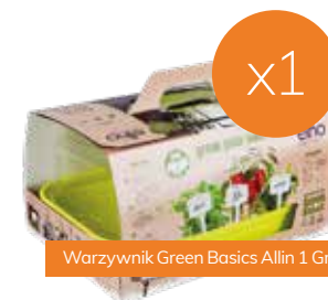
Warzywnik Green Basics Allin 1 Growkit