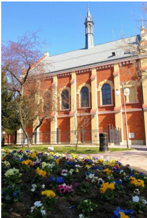
Jasło | autor: Urząd Miasta Jasła