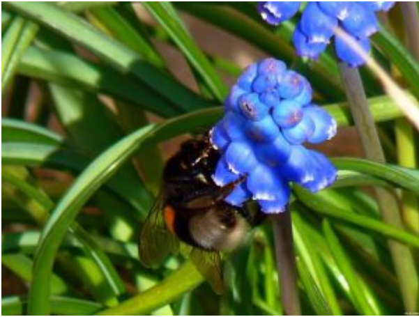
Jasło | autor: Wiesław Telega