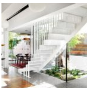
That house - Austin Maynard Architects