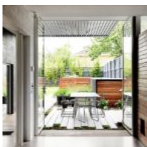
That house - Austin Maynard Architects