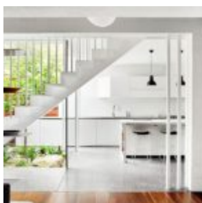
That house - Austin Maynard Architects