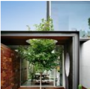
That house - Austin Maynard Architects