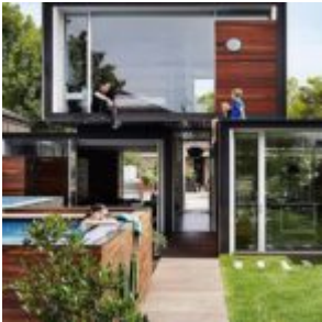
That house - Austin Maynard Architects