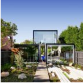
That house - Austin Maynard Architects