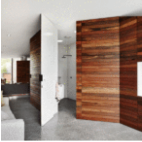
That house - Austin Maynard Architects