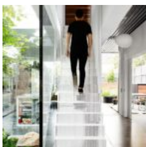
That house - Austin Maynard Architects