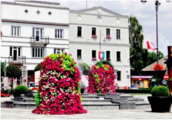
Kęty - Artur Christ