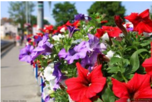
Międzyrzecz - Kazimierz Czułup