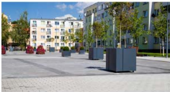
Lubin piękniejszy z roku na rok