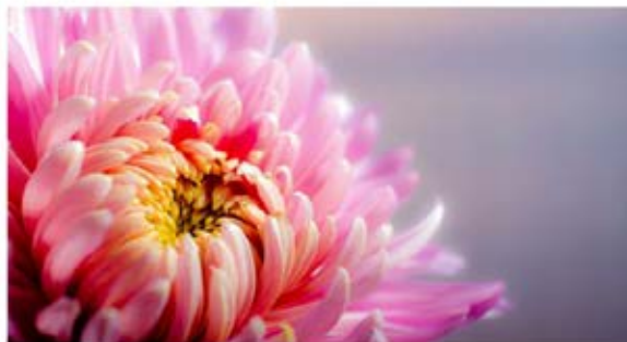
Nadchodzi czas chryzantemy