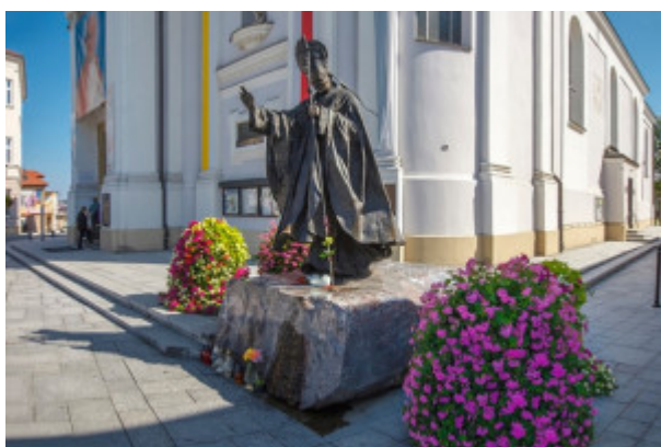
Wadowice - lato

Na brukowanych podjazdach, w bezpośrednim otoczeniu świątyń sprawdzą się mobilne rozwiązania - takie, jakie zdobią już między innymi Bazylikę Mniejszą Ofiarowania Najświętszej Maryi Panny w Wadowicach. Od lat podwoje świątyni oraz pomnik Jana Pawła II zdobią niewysokie, acz efektowne wieże kwiatowe , w zależności od sezonu ukwiecane między innymi stokrotkami, pelargoniami czy też surfiniami. Nasadzenia zmieniają się z każdym sezonem - dzięki temu statua jest pięknie podkreślona niemalże przez cały rok. Aby kontynuować tę tradycję również po sezonie kwitnienia, dobrym pomysłem jest wypełnienie kwietnika gałązkami świerku.