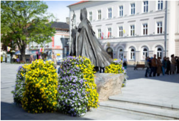
Wadowice - wiosna